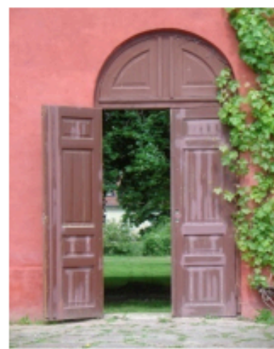
NYS Career Centers