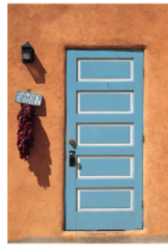
NYS Commission for Blind